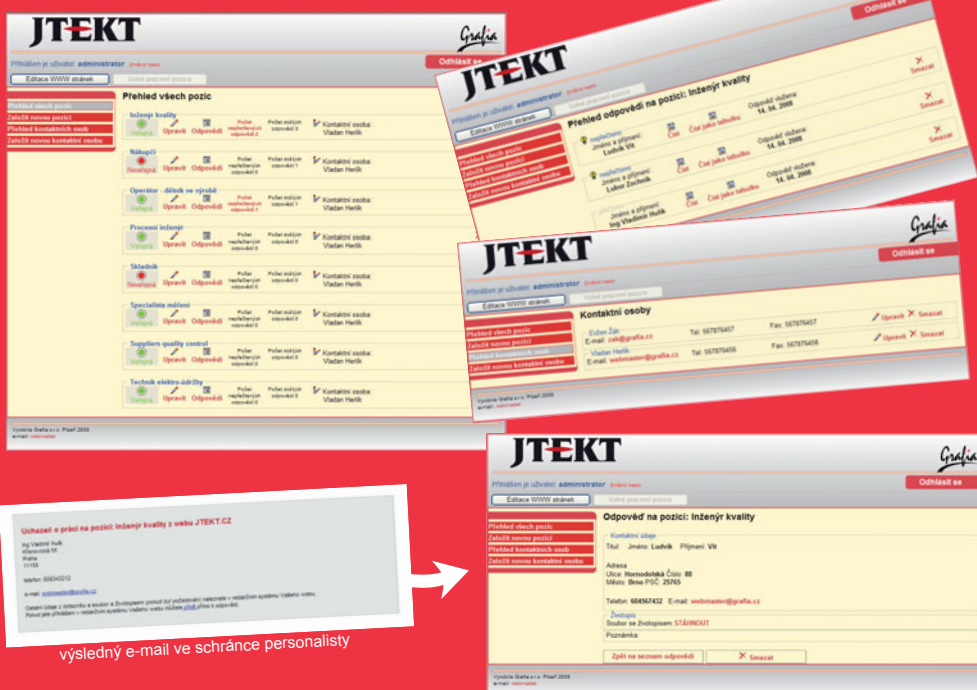
výsledný e-mail ve schránce personalisty

Hledáte neustále zaměstnance pro Vaši společnost?